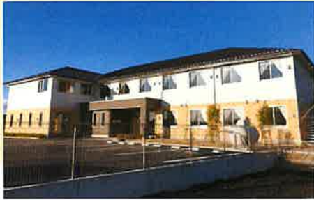
居室間取り (例) 18.60㎡

サービス付き高齢者向け住宅登録番号 岐阜2130005 1F 訪問介護指定事業所 ケアネットリゾン鶯沼 指定訪問介護事業所 No.2170502096 TEL (058) 379-0330 FAX (058) 379-0331