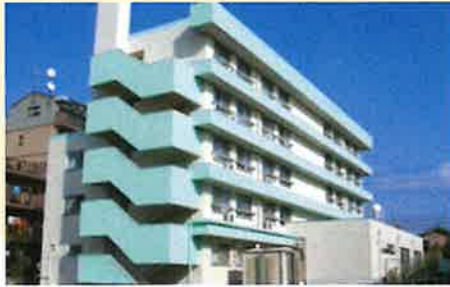
居室間取り (例) 18.00㎡

全室個室でプライバシーを確保。 慣れ親しんだ家具等もお持ち込みいただいて 自由にレイアウトが可能です。