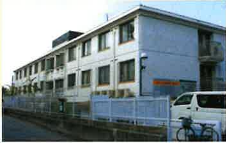
居室間取り (例) 15.00㎡

全室個室でプライバシーを確保。 慣れ親しんだ家具等もお持ち込みいただいて 自由にレイアウトが可能です。