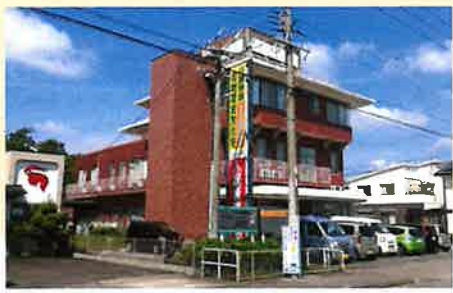
居室間取り (例) 13.50㎡

1F 訪問介護指定事業所 ケアネットリゾン各務原 指定訪問介護事業所 No.2170501130 TEL (058) 380-2711 FAX (058) 371-0300