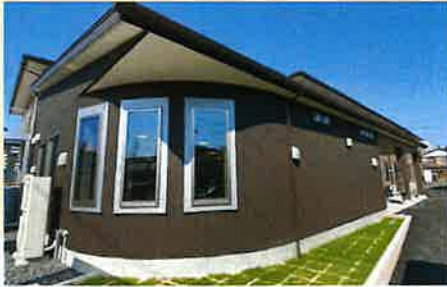
居室間取り (例) 18.60㎡

サービス付き高齢者向け住宅登録番号 愛知21007 1F 訪問介護指定事業所 ケアネットリゾン勝川 指定訪問介護事業所 No.2372505905 TEL (0568)27-6071 FAX (0568)27-6072