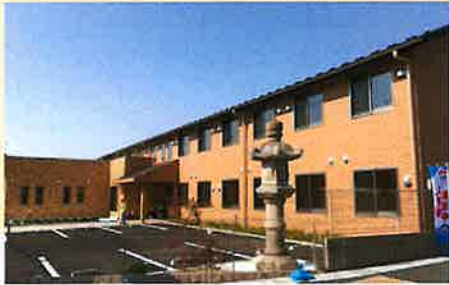
居室間取り (例) 18.60㎡

サービス付き高齢者向け住宅登録番号 愛知16004 1F 訪問介護指定事業所 ケアネットリゾン岩倉 指定訪問介護事業所 No.2374700603 TEL (0587)38-5151 FAX (0587)38-5153