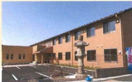
居室間取り (例) 18.60㎡

サービス付き高齢者向け住宅登録番号 愛知16004 1F 訪問介護指定事業所 ケアネットリゾン岩倉 指定訪問介護事業所 No.2374700603 TEL (0587)38-5151 FAX (0587)38-5153