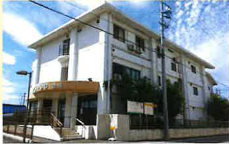
居室間取り (例) 13.50㎡

全室個室でプライバシーを確保。 慣れ親しんだ家具等もお持ち込みいただいて 自由にレイアウトが可能です。