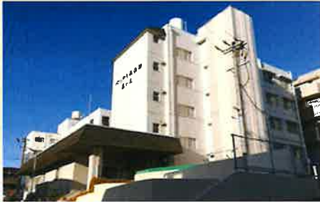
居室間取り (例) 13.50㎡

全室個室でプライバシーを確保。 慣れ親しんだ家具等もお持ち込みいただいて 自由にレイアウトが可能です。