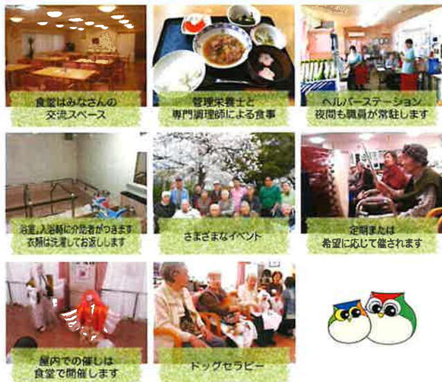
食堂はみなさんの 交流スペース